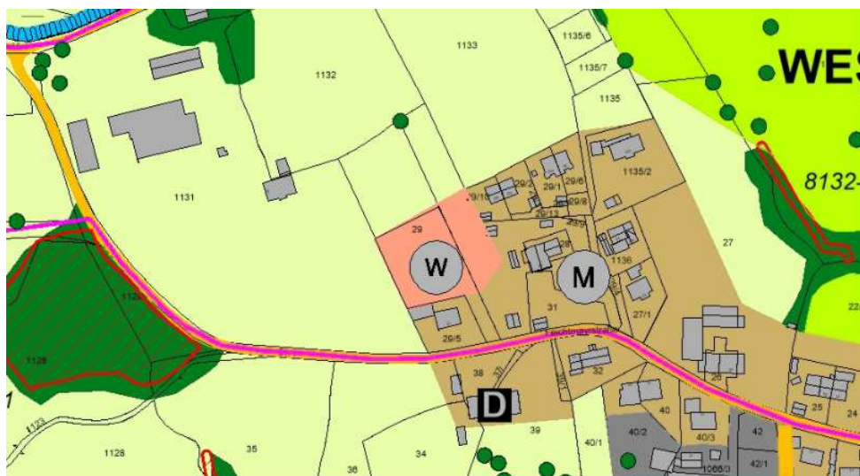
Abb. 2 Auszug aus dem Flächennutzungsplan der Gemeinde Wessobrunn, Entwurfsstand 4. Auslegung

Im Zuge der Neuaufstellung des Flächennutzungsplans der Gemeinde soll die Fläche als Wohnbaufläche dargestellt werden.