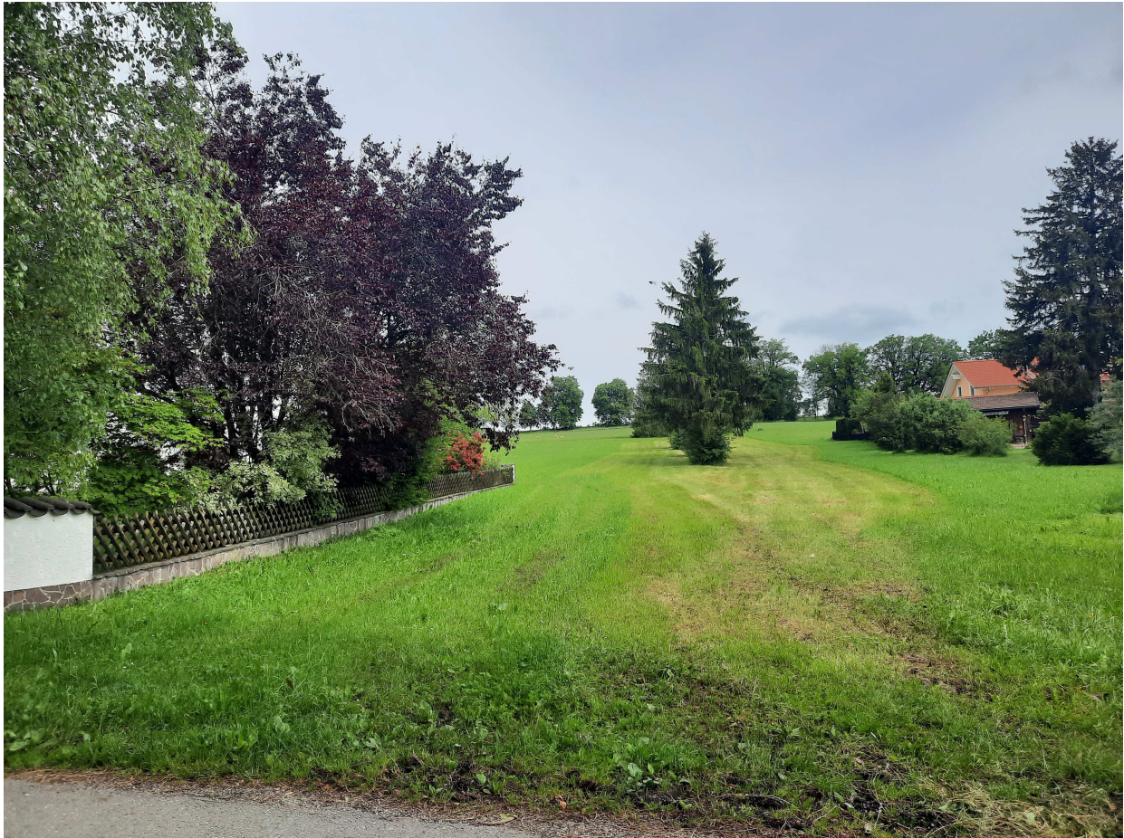
Abb. 5 Blick auf das Grundstück Fl.Nr. 29, mittig im Bild: einzelne Fichten