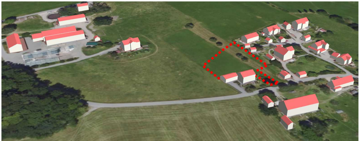
Abb. 1 Lage und Abgrenzung des Satzungsgebietes (rot) auf Grundlage Luftbild BayernAtlas (Mai 2024)

Mit der Ausarbeitung der Einbeziehungssatzung wurde die Arbeitsgruppe für Landnutzungsplanung (AGL) beauftragt.