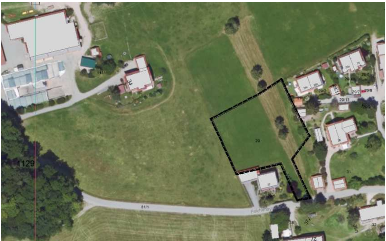
Abb. 3 Lage und Abgrenzung des Satzungsgebietes (rot) auf Grundlage Luftbild mit Parzelle BayernAtlas (Mai 2024)

Der räumliche Geltungsbereich der Einbeziehungssatzung liegt am westlichen Ortsrand des Ortsteils Wessobrunn. Er umfasst eine Teilfläche des Grundstücks Fl.-Nr. 29 der Gemarkung Wessobrunn. Die Größe beläuft sich auf insgesamt 3.330 m 2 . Die Fläche ist grünlandwirtschaftlich genutzt und steigt von Süden nach Norden leicht an. Nördlich und westlich grenzen landwirtschaftlich genutzte Grünlandflächen an, im Osten und Süden bestehende Wohnbebauung aus Einzel- und Doppelhäusern. Die Erschließung ist über bestehende Verkehrsfläche (Ortsverbindungsstraße) gesichert.